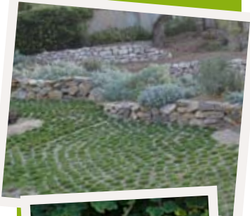
LORE ET CHEA

Pour réaliser des motifs et créer un couvert original et plus facile d'entretien, plantez plusieurs espèces en mélange.