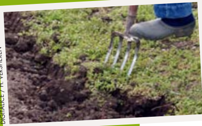
DIGITALICE / H. VERSHEREN